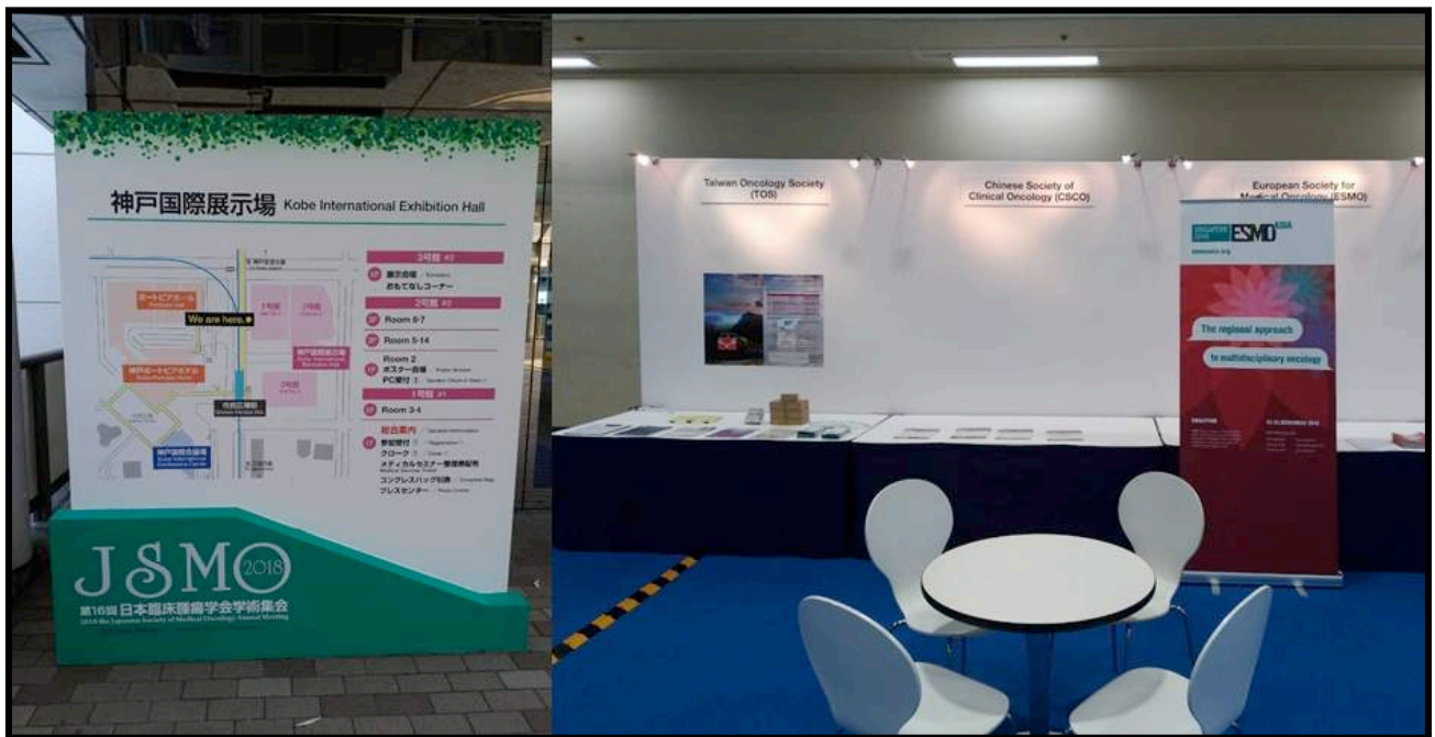
[107年7月19~21日，假神戶國際會議中心暨展會館，本會與JSMO合作，前往設攤參展]